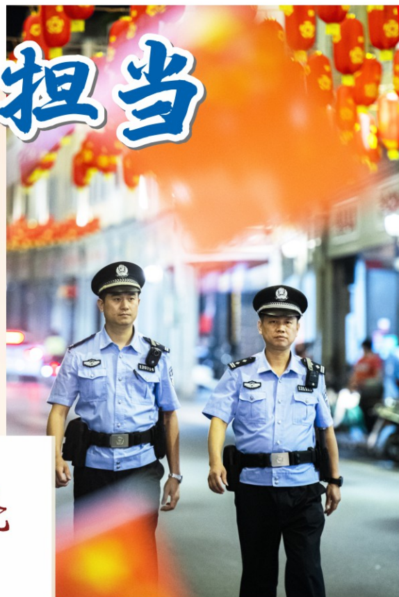
特警穿梭在大街小巷为大家保驾护航

满月高高挂在穹苍 外出的人儿赶在回家的路上 人们都忙着与家人赏月 而我的兄弟姐妹们 也都风雨兼程赶在路上 走在大街小巷和各处村庄 侦查办案疏导交通或是值勤站岗 只为了给人们守护皎洁的月光 我的兄弟姐妹们背向嫦娥吴刚 默默想念着家人 再点燃一柱心香 祈求明月更圆 把这个世界照得更亮 祈求人们归家出行的道路 更加祥和康庄 月亮，月亮 你满身都是光芒 你装饰了人们赶路的风光 你圆了人们团聚的梦想 而我的兄弟姐妹们头顶的警徽 闪照着你乍凉还暖的的明光 也成了这个世界的风景 辉映着守护国庆的忠诚铿锵 装饰了人们中秋团圆的梦想