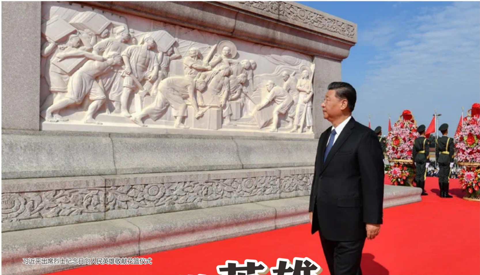
习近平出席烈士纪念日向人民英雄敬献花篮仪式