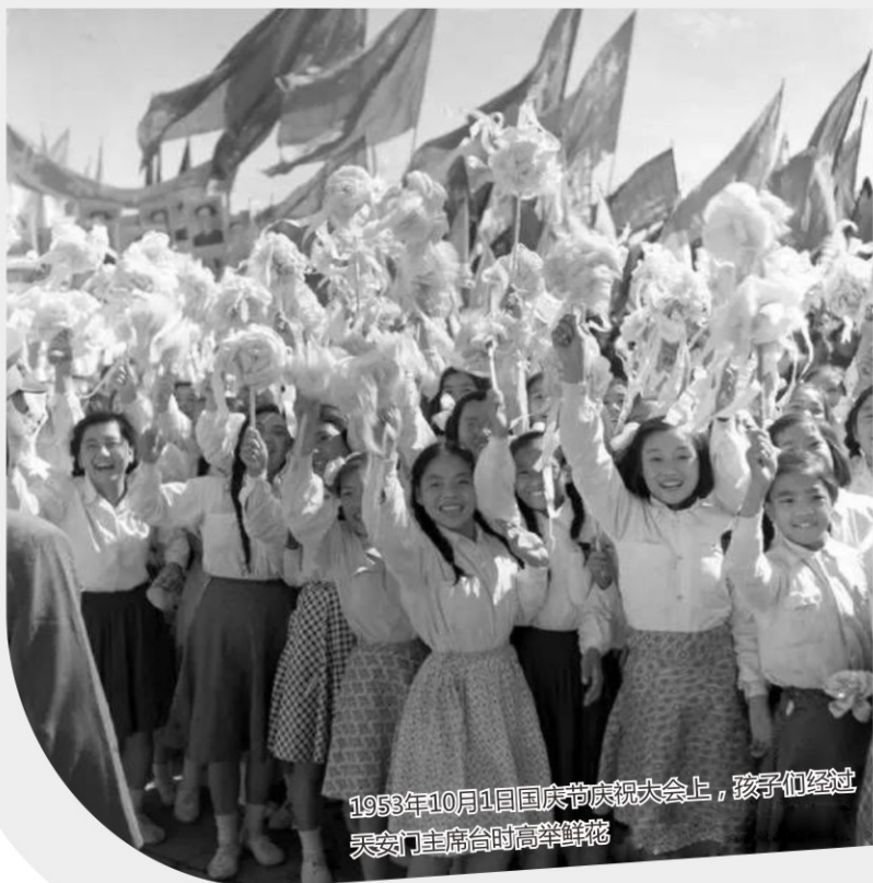
1953年10月1日国庆节庆祝大会上，孩子们经过天安门主席台时高举鲜花