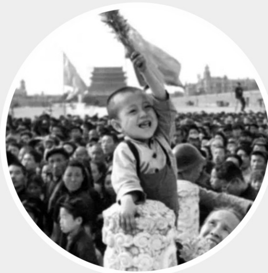
1950年北京天安门广场参加国庆游行的儿童

“中秋国庆喜相逢，平安快乐两相依。”在这举国欢庆的日子，我们会在庄严肃穆的英雄纪念馆里，感受无数中华儿女的爱国壮志，也会在古迹斑驳的红色遗址里，缅怀革命先烈的丰功伟绩，更会在高高飘扬的国旗下，诉说对祖国母亲的深情……历史洪流滚滚，我们伟大的祖国母亲历经沧海桑田、风雨变迁，许多记忆或许已湮没在历史的长河中，但不变的，是我们和祖国母亲魂牵梦萦的情感。让我们从老照片的掠影里，一起感受祖国母亲的日益强盛，一起重温祖国的“花朵”们在建国初期为祖国华诞献礼的场景。