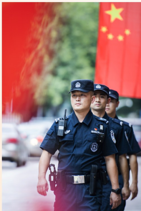
全力以赴护航节日平安