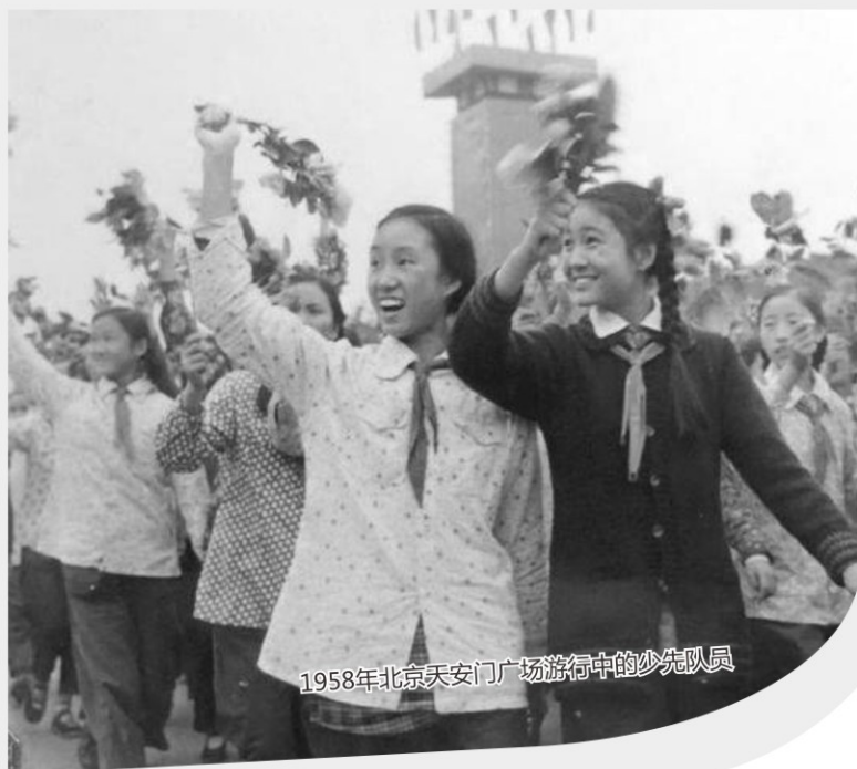
1958年北京天安门广场游行中的少先队员