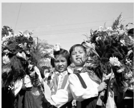
1951年10月1日，庆祝中华人民共和国成立2周年典礼在北京天安门广场隆重举行。图为参加游行的少年儿童队队员