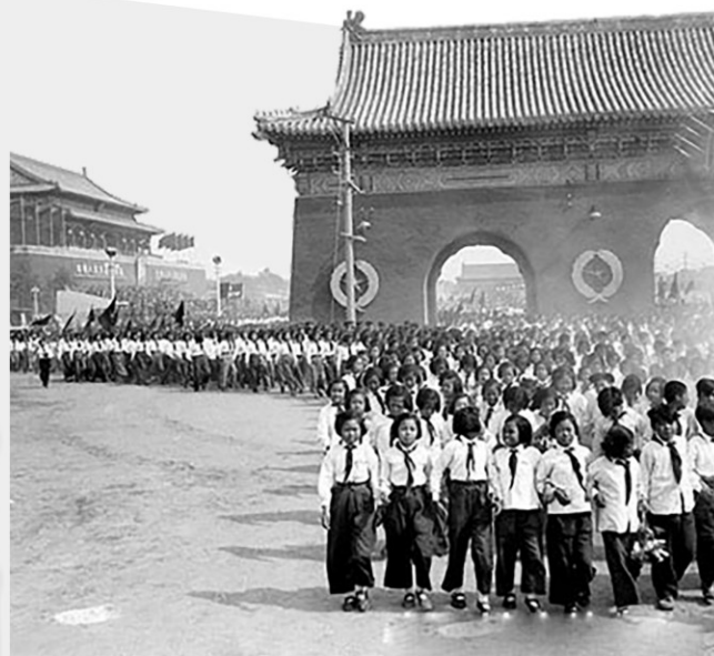
1950年国庆节当天，学生游行队伍经过北京市东城区中山公园