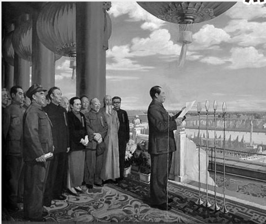
1949年10月1日，中华人民共和国成立，在北京天安门广场举行开国大典