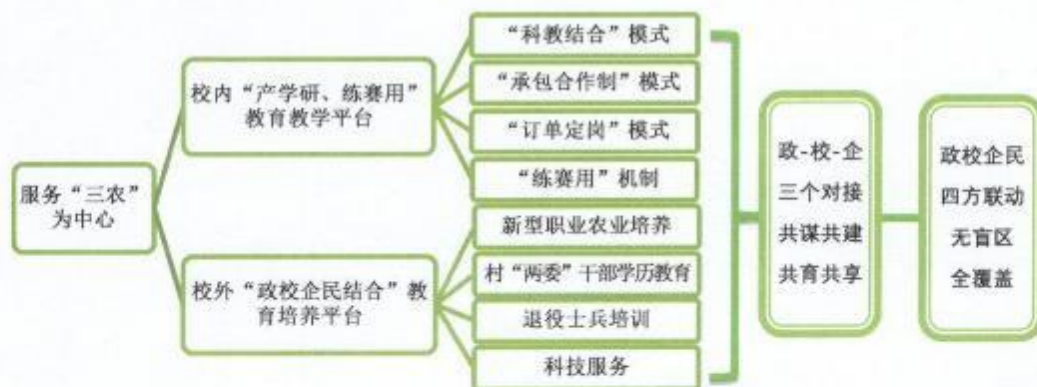
图1 “1234”“三农”实用人才培养体系

项目实施的内容：以服务“三农”为中心；构建校内、校外教育培养两个平台；实施政校企三个对接；实现政校企民四方联动，精准培养“三农”实用人才。